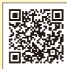
福岡県子どもまんなかポータルサイト

「子どもの権利条約」では子どもが大切にされ、守られるために、 4つの大事な権利 が決められています。右の画像で読み取ると「子どもの権利」について知ることができます。