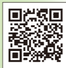
子ども家庭庁 子ども向けホームページ

みなさんに知ってもらいたい情報がわかりやすく、書かれています！右の画像で読み取ると見ることができます。