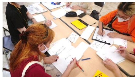
かんだ日本語パンジー（生活者向け日本語教室）の様子