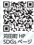
苧田町 HP SDGs ページ