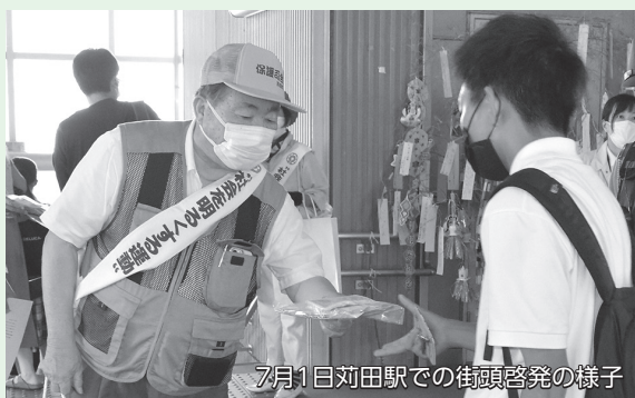
7月1日荻田駅での街頭啓発の様子

"社会を明るくする運動"は、すべての国民が犯罪や非行の防止と罪を犯した人たちの更生について理解を深め、犯罪や非行のない明るい社会を築こうとする全国的な運動です。