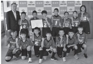
全国大会出場に先立ち、町長を表敬訪問した児童たち。

8月21日に茨城県で開催された「第31回全日本ドッジボール選手権全国大会」で、町内の児童たちが所属するチーム「ライジングサン」が福岡県代表として出場し、全国3位となりました。チームは荻田小学校体育館等で厳しい練習を積み、全国大会で快進撃を続けました。