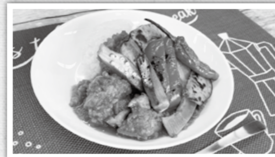
エネルギー 510kcal (ごはん込み)、塩分 3.4g

夏野菜にはビタミンが豊富に含まれており、夏バテや熱中症の予防、免疫力の向上、更には美容にも効果があります。旬の今が一番栄養価が高いといわれています。この機会にたくさんの夏野菜を食べて、今年の夏も元気に過ごしましょう!