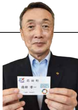
▲全職員に配布したSDGsのマーク入りの名札。