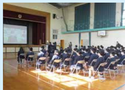
SDGs達成のために取り組んだことを町長に説明する子どもたち