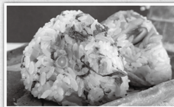
材料(1人分・各おにぎり2個分) (1人分)386kcal塩分2.9g

菜の花は抗酸化作用があり、ビタミンCも豊富なため免疫力を高めます。たけのこはカリウムが豊富で高血圧の予防にも良いといわれています。また、食物繊維も豊富に含まれているので便秘にも効果的です。旬の食材は特に栄養価が高いといわれています。コロナ禍でも季節を楽しんでストレスに負けない体づくりをしましょう!