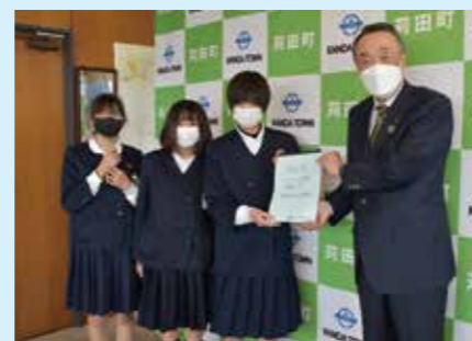
報告会の翌日、ジェンダー平等実現のための提案書を町長に提出