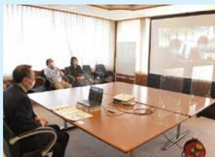
モニター越しに、子どもたちの報告に熱心に耳を傾ける遠田町長

3月11日には、南原小学校6年生の代表者6名が町長室を訪れ、SDGs目標5「ジェンダー平等を実現しよう」の達成に向けた提案書とSDGsの取組みの一環としてリサイクルするために学校で回収した古着を町長に手渡しました。初めは緊張している様子だった子どもたちも、町長とコミュニケーションを取る中で打ち解けていき、自分の言葉でSDGsへの想いを伝えることができました。小学校卒業前の子どもたちにとって、とても良い経験になったのではないのでしょうか。町としても、南原小学校の皆さんの想いをしっかりと受け止め、持続可能な苅田町を実現するために、SDGsの推進に取り組んでいきます。