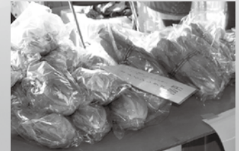
写真は昨年の様子