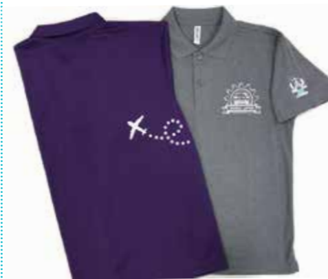
←胸に車、背中に飛行機のイラストを入 れて苅田町らしいデザインに。腕には豊 玉姫のワンポイントも。

毎年大人気のポロシャツを今年も販売します！ポロシャツの売上金の一部は、被災地支援のために募金します。購入希望の方は、苅田町観光協会までお問い合わせください。