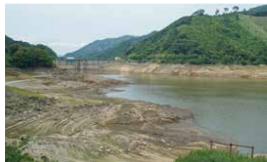
←油木ダムでは水が枯渇し、地肌 が露わに（6月9日撮影）。