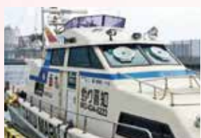
高速船「卓丸」で苅田港から空港までクルージング!

回 5/9 ⊕ 10:00 ~ 12:30 集 苅田港 幸町野積場 費 1,500円 定 20名 (10名以上で実施) 申 実施日の8日前まで