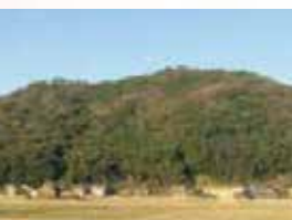
小波瀬駅から二先山を越え、白石地区に出て駅に戻ります。

回 5/23 ⊕ 9:00 ~ 14:00 集 小波瀬西工大前駅横 ロータリー広場 費 大人 500円 子供 300円 ※子供は保護者の同伴要 定 20名 (5名以上で実施) 申 実施日の5日前まで