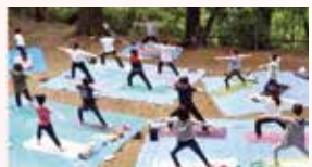
ヨガマットかバスタオルが必要です。動きやすい服装で。

回 5/2 ⊕ 8:30 ~ 13:30 集 西部公民館 費 2,000円 (昼食代含む) 定 20名 (10名以上で実施) 申 実施日の8日前まで