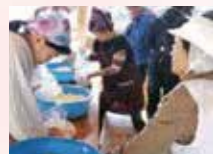
エプロン・三角巾・タオルが必要です。

回 5/12 ⊕ 10:00 ~ 13:00 集 等覚寺特産グループ 対 中学生以上 費 4,000円 (昼食代含む) 定 12名 (5名以上で実施) 申 実施日の3日前まで