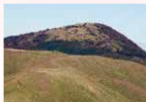
青龍窟・広谷湿原・周防台・桶ヶ辻・天狗岩を巡ります。

回 5/24 ⊕ 8:40 ~ 15:00 集 西部公民館 対 大人 500円 子供 300円 定 20名 (5名以上で実施) 申 実施日の9日前まで