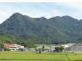
猪熊山、ソーエム、龍智山、山の神山、隠れ山を踏破します。

回 5/31 ⊕ 8:30 ~ 15:00 集 猪熊公民館 (駐車場有) 費 大人 500円 子供 300円 定 20名 (5名以上で実施) 申 実施日の9日前まで