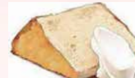
エプロン、三角巾、ボールペンが必要です。

回 6/11 ⊕ 14:00 ~ 16:00 集 トリオレ (富久町) 対 中学生以上 費 1,500円 定 6名 (2名以上で実施) 申 実施日の7日前まで