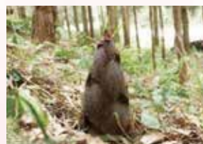
スコップか鍬が必要です。動きやすい靴と服装で。

回 4/26 ⊕ 9:00 ~ 11:30 集 等覚寺山口分校跡広場 対 小学生以上 費 500円 定 30名 (10名以上で実施) 申 実施日の9日前まで