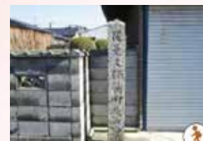
浄厳寺、木実原神社、一本松、宇原神社などを通ります。

回 5/15 ⊕ 9:30 ~ 12:30 集 役場東側駐車場 費 700円 + バス代 170円 定 10名 (3名以上で実施) 申 実施日の7日前まで