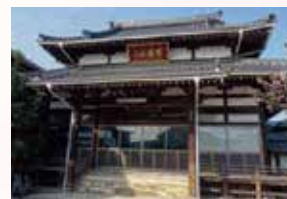
松山寺で法話を聞き、座禅について学び、体験します。

回 4/11 ⊕ 9:30 ~ 11:30 集 松山寺 (富久) 費 700円 定 15名 (10名以上で実施) 申 実施日の8日前まで