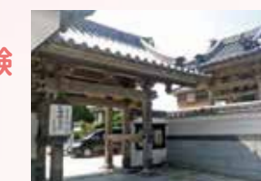
納経後にお寺から抹茶のふるまいもあります。

回 5/22 ⊕ 9:30 ~ 11:30 集 東傳寺 (神田町) 費 1,000円 定 20名 (5名以上で実施) 申 実施日の7日前まで