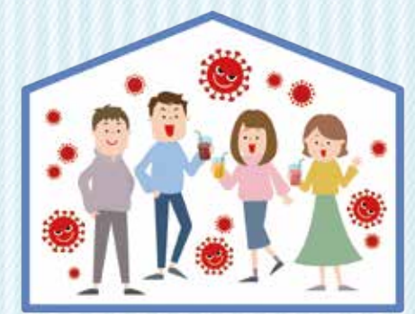
↑このような空間は避けましょう

換気が悪く、人が密に集まって過ごすような空間に集団で集まることを避けてください。 イベントを開催する方は、風通しの悪い空間や人が至近距離で会話する環境は、感染リスクが高いことから、その規模の大小にかかわらず、その開催の必要性について検討するとともに、開催する場合には、風通しの悪い空間をなるべく作らないなど、イベントの実施方法を工夫してください。