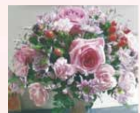
ハサミと新聞紙が必要です。

回 5/14 ⊕ 13:30 ~ 16:30 集 西部公民館 費 2,000円 (お菓子代含む) 定 6名 (3名以上で実施) 申 実施日の7日前まで