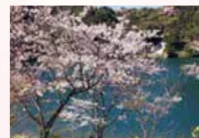
石塚山古墳周辺の桜を皮切りに町内の桜の名所を散策。

回 4/5 ⊕ 8:40 ~ 12:00 集 役場東側駐車場 費 大人 500円 子供 300円 定 20名 (5名以上で実施) 申 実施日の9日前まで