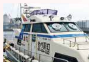
高速船「卓丸」で苅田港から空港までクルージング!

回 4/25 ⊕ 10:00 ~ 12:30 集 苅田港 幸町野積場 費 1,500円 定 20名 (10名以上で実施) 申 実施日の8日前まで