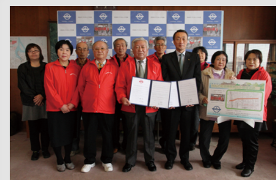
1月9日、苅田まちづくりカレッジOB会が道路サポートの協定を締結しました。今後、京町周辺道路の美化活動を行います。