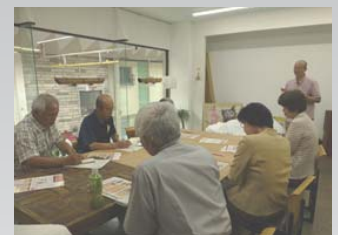
昨年度の館外研修の様子 （北九州市八幡東区）

【講座日程】9月下旬～平成31年3月（年間20回程度）原則水曜日の午後7時～9時