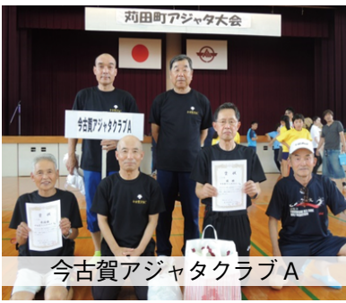
今古賀アジャタクラブA