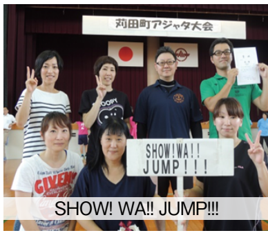
SHOW! WA!! JUMP!!!