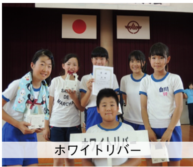
ホワイトトリバー