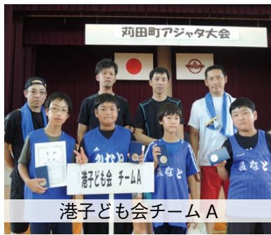
港子ども会チームA