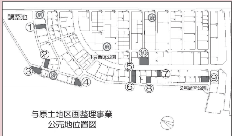
与原土地区画整理事業 公売地位置図

※①、⑩以外の保留地について抽選を行います。①、⑩の保留地は随時販売中（先着順）です