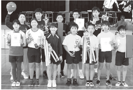
3on3 バスケ優勝チーム

▽小学生の部Aパート・みんなにまかせる ▽小学生の部Bパート・トリプルY ▽一般男子の部・GYMRATS ▽一般女子の部・Mi・ke 問 荇田町体育協会事務局 ☎093・434・4726