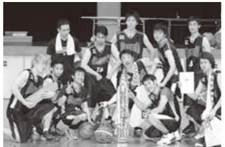
バスケット一般男子優勝