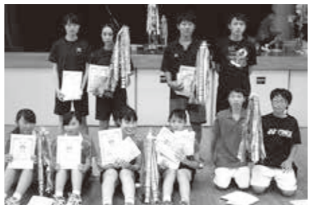
バドミントン優勝者