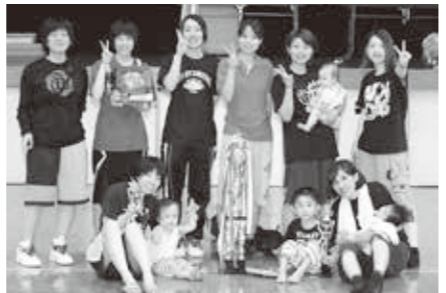
バスケット一般女子優勝