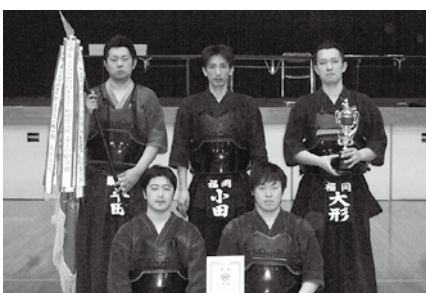
剣道大会 (一般団体の部)