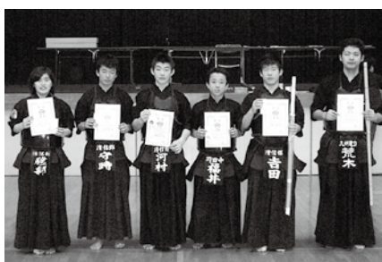
剣道大会 (個人戦の部)