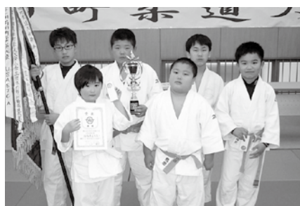
柔道大会 (小学生団体の部)