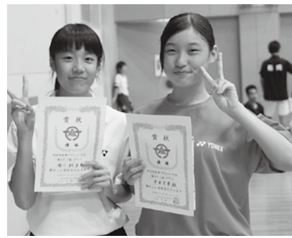
→ 女子ダブルスC級優勝

荻田町秋季男女混合バレーボール大会優勝チーム 10月11日(日) 日産自動車体育館 ▼男女混合の部：C LOVE 荻田町体育協会 ☎093・434・4726