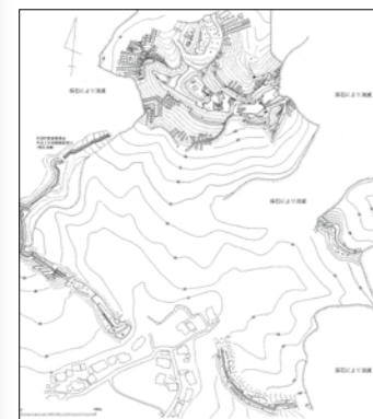
荇田町松山城縄張り図 (作図:九州歴史資料館)