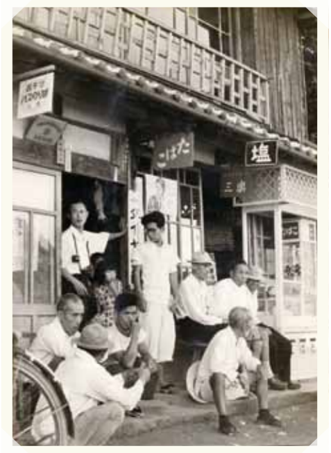
昭和30年片島バス停(西鉄)