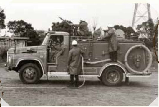
化学消防車の訓練(町営グラウンド)