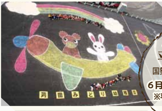
空港お絵かき大会(翌年新北九州空港開港)