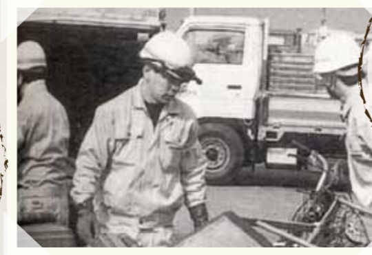
阪神大震災・町からボランティア活動に参加