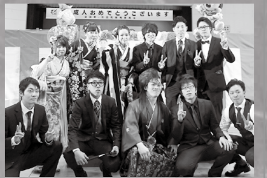
実行委員のメンバー