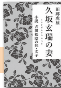
「久坂玄瑞の妻」 田郷虎雄/著 KADOKAWA

【一般】幕末男子~松陰と松下村塾に集まった若者たち~ 今年の大河ドラマの主人公は吉田松陰の妹、「文」 です。その文を中心に明治維新で活躍した若き志士 たち、吉田松陰、高杉晋作、伊藤博文などの人とな りがわかる本を集めました。幕末 を動かし、明治維新を起こしたド ラマを楽しんでください。