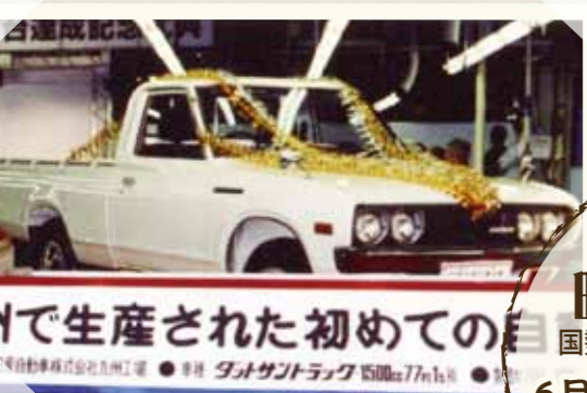
九州で生産された初めての自動車