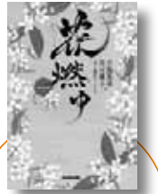
花燃ゆ 1 大島里美/(他)著 NHK出版

新刊は他にもあります。お探しの本はお問い合わせください。※パソコンや携帯電話からも蔵書検索ができます。くわしくは図書館ホームページをご覧ください。