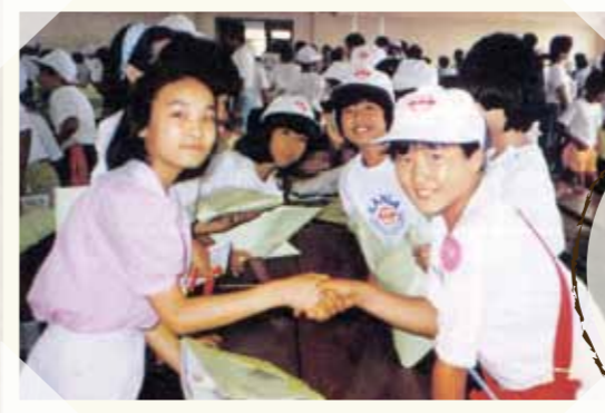
苅田町少年の船で韓国訪問