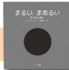
「まるいまるい」 イエラ・マリ/著 ブロンズ新社

【児童】まるいおはなしがいっぱい まる、さんかく、しかくの形のなかのまるにスポッ トをあてます。コロコロしてかわいいイメージばか りですが、楽しいおはなしの他にタメになるおはなし もあります。本を読んでみんなでまるいえがおに なりましょう。