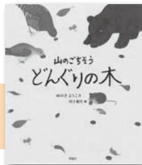
「山のごちそう どんぐりの木」 ゆのきようこ／著 理論社