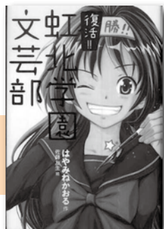
「復活！！虹北学園文芸部」 はやみねかおる／著 講談社