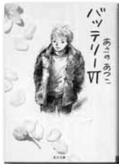
「バッテリーVI」 あさのあつこ／著 角川書店

秋はスポーツの秋、文化の秋…そこで、運動部や文化部が活躍する部活小説を集めてみました。現役の部員も、OBもこれから部活動を始める方も、まずは本を手にとってみませんか？