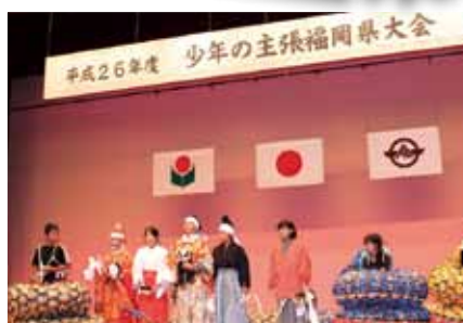
かぐらのおひろめ