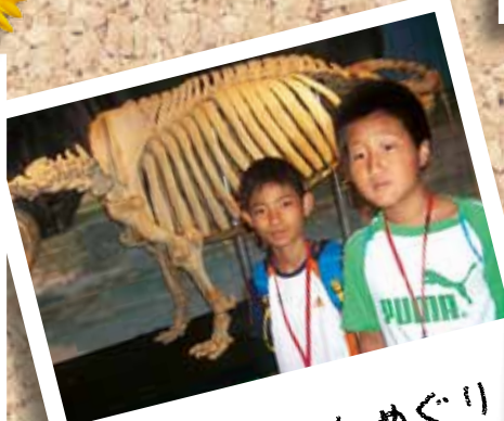
はくびつがんめぐり