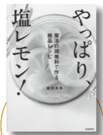
「やっぱり、塩レモン!」河出書房新社

※パソコンや携帯電話からも蔵書検索ができます。くわしくは図書館ホームページをご覧ください。