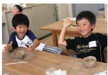
とうげいにトライ!!