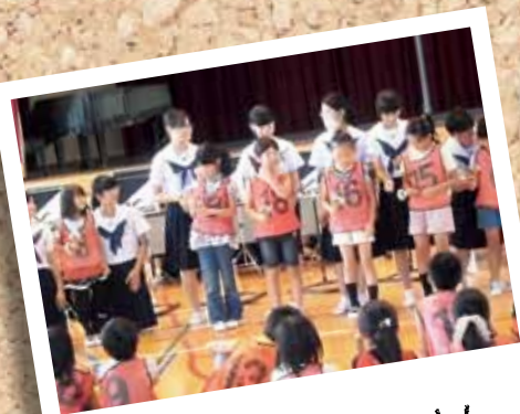
ハンドベルたいけん

夏休み期間中、町内外各地で開催されたさまざまな催しには、子どもたちの元気な声が響きました