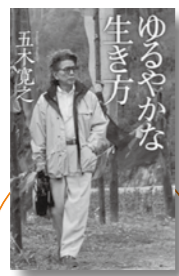
「ゆるやかな生き方」実業之日本社