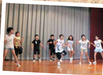
ダンスきょうしつ