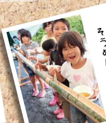
すしめては しおは、て