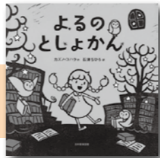
「よるのとしょかん」 カズノ・コハラ／著 光村教育図書