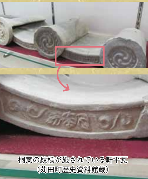
桐葉の紋様が施されている軒平瓦 (苅田町歴史資料館蔵)