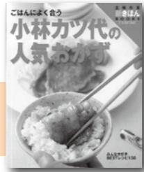
「小林カツ代の人気おかず」 ワイド版 小林カツ代／著 主婦の友社