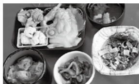
料理内容は日によって替わります

必着 申込方法等詳細はお問い合わせください。 ★問合せ先 「西日本新聞 金婚夫婦表彰式」事務局 〒810・8721 福岡市中央区天神1丁目4・1 ☎ 092・711・5620