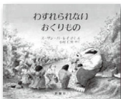
「わすれられないおくりもの」 スーザン・バーレイ／著 評論社