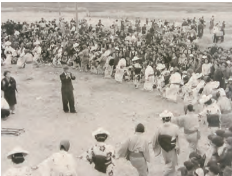
第1回かんだ港まつり風景

荇田町は港の発展とともに成長し、その象徴である港で毎年「かんだ港まつり」が開催されています。港まつりの第1回目は昭和53年5月。それ以前にも港まつりが開催されていましたが、人口3万人突破記念と町民の調和をめざして、装いを新たに第1回目が行われました。この時には花火大会のほかにパレード、フェリーの一般公開、ミスかんだ港まつりコンテストなどの催しものが行われました。