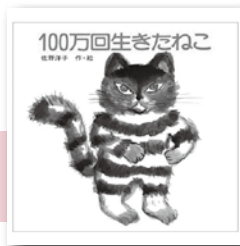
「100万回生きたねこ」 佐野洋子／著 講談社

お友だちとケンカしたとき、お母さんにおこられたとき、大切なペットが死んじゃったとき、他にもなみだが出る時は、たくさんあります。今回は、うれしい時、悲しい時などの、いろいろななみだのお話をあつめました。なみだって、いろいろな味があるんですね。