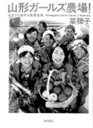
山形ガールズ農場!