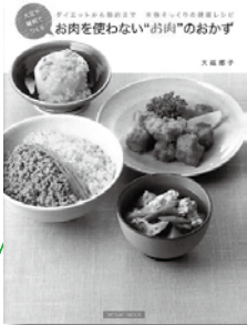
お肉を使わない “お肉”のおかず