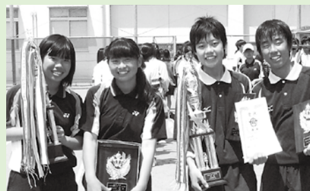
△春季ソフトテニス大会