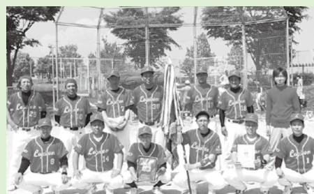
△壮年ソフトボール大会