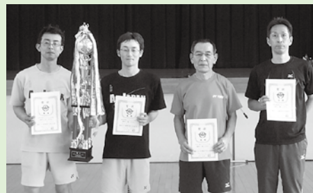
△春季バドミントン大会