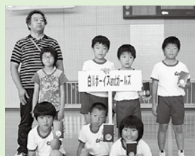
小学生4年以下の部 △白川ボーイズ and ガールズ