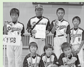
小学生の部 △馬場小ペガサスB