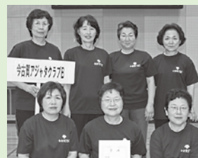
シニアの部 △今古賀アジャタクラブB