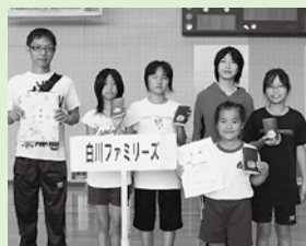
ファミリーの部 △白川ファミリーズ