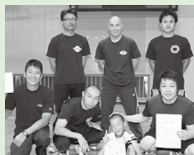
一般の部 △苅田消防