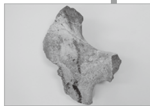
(写真) 青龍窟で見つかった獣骨片

青龍窟では、ステゴドンゾウやナウマンゾウなど陸上生物の化石が発見されており、特に、ナウマンゾウ幼ゾウの完全な頭ガイコツは世界でも珍しい発見です。ところが、化石の宝庫とも言える一方で、海生生物の化石は見つかりません。その原因は、平尾台を形成している石灰岩が海底から隆起する間に、石灰岩とともに化石がマグマの熱によって溶けてしまったからです。しかし、溶けた石灰岩は再結晶して大理石となります。山口県にもカルスト台地の鍾乳洞「秋芳洞」がありますが、石灰岩の質にそれぞれの特徴があるのです。