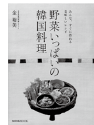
野菜いっぱい韓国料理