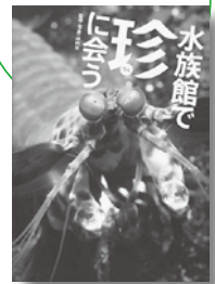
水族館で珍に会う