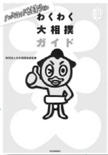
ハッキョイ! せきトリくん わくわく大相撲ガイド