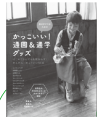
男の子ママのための かっこいい! 通園&通学グッズ