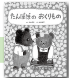
「たんぼぼのおくりもの」 片山令子／著 ひかりのくに