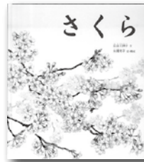
「さくら」 長谷川摂子／著 福音館書店

絵本の中にもカラフルな花がいっぱい咲いています。さあ、絵本を開いて春を感じてみませんか？