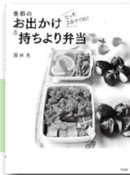
「たった3品でOK！季節のお出かけ&持ち寄り弁当」 藤井 恵／著 講談社