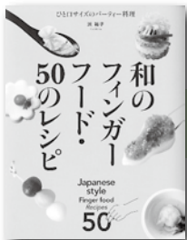
「和のフィンガーフード・50のレシピ」 浜 裕子／著 誠文堂新光社