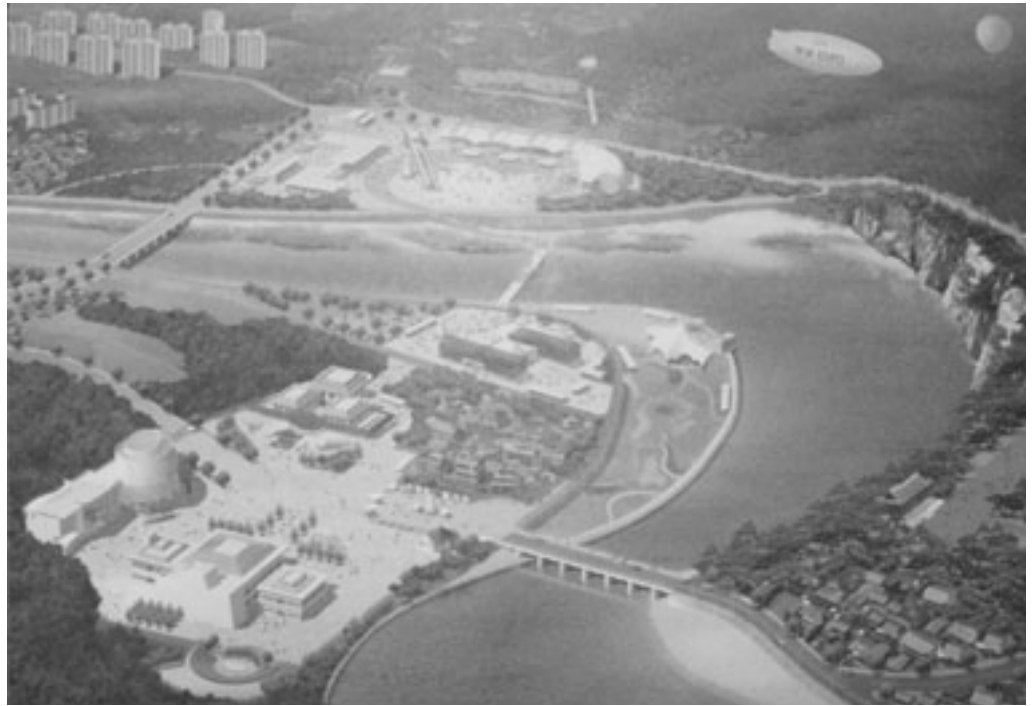
▲写真はメイン会場の完成予想図