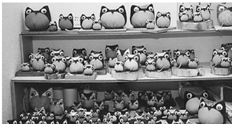
※今回販売したフクロウのオリジナル作品