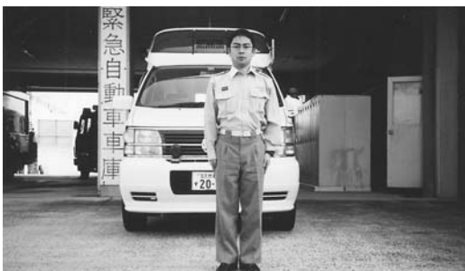
火災・救急・救助・その他出動件数（H14年10月末現在）