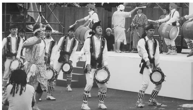
▲毎年「かんだ港まつり」を盛り上げる沖縄県人会の「エイサー」

皆さんは西工大がどんな大学なのか意外と知らないのではないでしょう。か。「産・学・官」の連携が必要といわれる時代のなか、西工大は「地域に開かれた大学」を目指して、さまざまな事業活動を行っています。また、西工大には、全国各地から約1800人ももの学生が集まり、荻田町を中心に学生生活を送っています。今回、西工大の紹介に併せて、西工大が地域とどのように関わっているかとしていのかや学生たちの部活動、また、県外から来た学生が荻田町にどのような印象を持っているのかなどを紹介したいと思います。