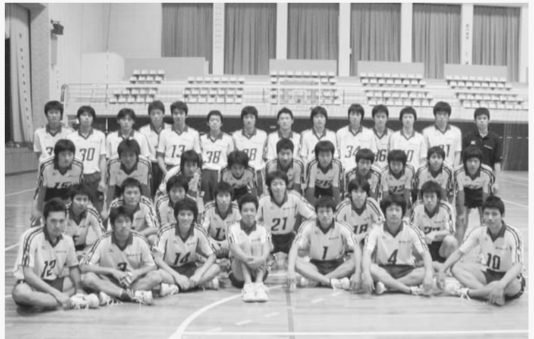
▲男子バレーボール部（部員41人、マネージャー1人）

練習は真剣に、練習後は楽しく。常に勝つためのメリハリをつけた練習で、平成12年は九州学生弓道新人戦で優勝、九州学生弓道選手権大会で準優勝。昨年は全日本学生弓道選手権大会で3位となる。