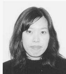
加登都さん (建築4年)