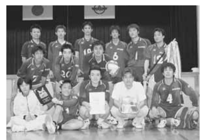
▲一般男子の部優勝(新津クラブ)