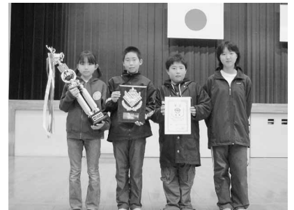
▲小学生Aパートの部優勝