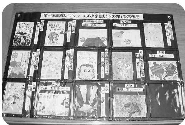
▲小学生以下の部入賞作品