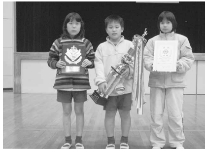
▲小学生Bパートの部優勝