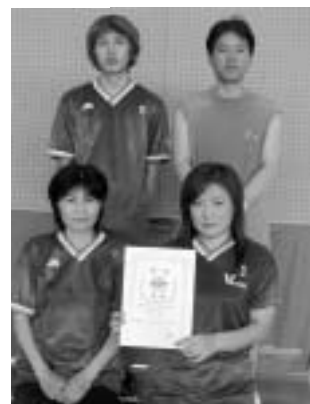
トリムフリーの部 優勝 ビクトリー