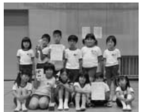
チャイルドの部優勝 白川ミッフィーズ