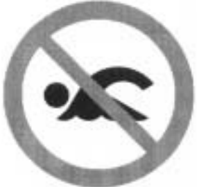
遊 泳 禁 止

小中学校の夏休みが始まりました。 水の事故を防止するために ため池、ダム、水路で釣りをしたり泳いだりしないでください。 特に、ため池、ダム、水路は転落すると危険です。 見かけた時は注意してください。 問い合わせ先 農政課 TEL093・434・1893