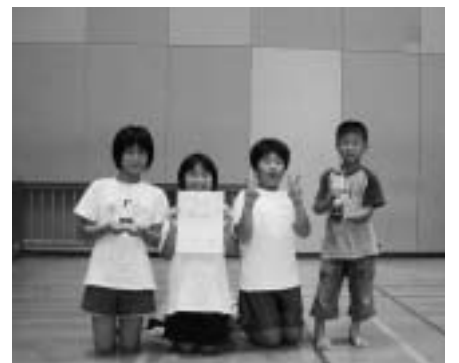
親子の部優勝 苅田サッカーサポーター部

各チームのタイムは3回のうちよいタイム2つの合計とする。 最高タイム賞の後の 印は苅田町最高タイムを表す。