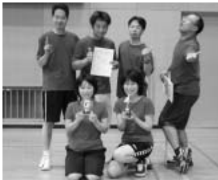
一般の部優勝 プリプリD