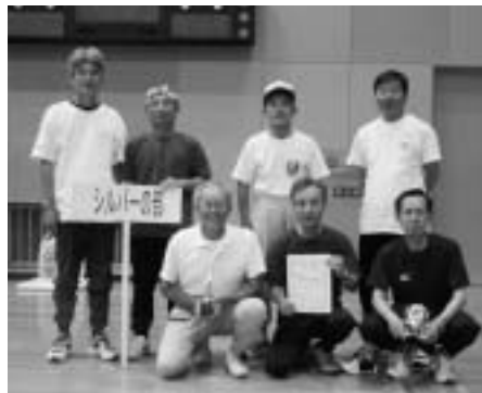
シルバーの部優勝 今古賀アジャタクラブ