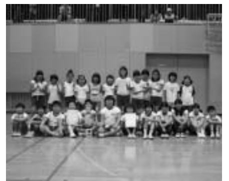
小学生の部優勝 白川キッズ