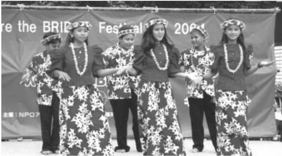
民族衣装を着て、踊りを披露する子ども大使のみなさん