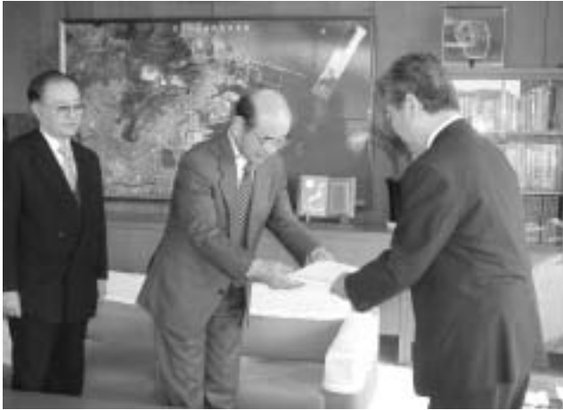
荻田町環境審議会答申

荻田町では、今後の町の環境づくりを進めていくうえで基本的な方針を示した、かんだ環境未来図（荻田町環境基本計画）を策定しました。