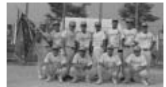
ソフトボール大会優勝