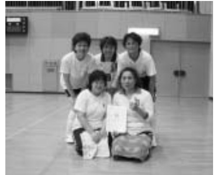
レディースシルバーの部優勝 WeLoveバレー