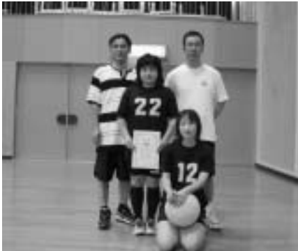
トリムシルバーの部優勝 黒門

(トリムフリーの部) KX KHS ドリームス (レディースシルバーの部) WeLoveバレー 馬場小あねご (レディースフリーの部) Mystia 椿姫A 椿姫B (ファミリーの部) 片島A 片島B 片島C