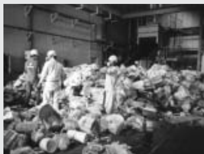
収集されたごみの選別作業

2月27日、かんだ環境会議を開催し、公募（現在32名）の会員で協議、9つの基本目標と4つの分科会で取り組むことになりました。分科会は第1（水、空気、音）第2（ごみ、地球環境）第3（自然、まちなみ、歴史、文化）第4（環境教育等）となりました。 このうち第2分科会は5月23日、第1回では、ごみでは何が問題なのか、現状を知ることが始めようということにしました。