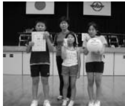
ファミリーの部優勝 片島A