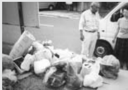
ごみステーションを視察し、住民の意見を聞く活動