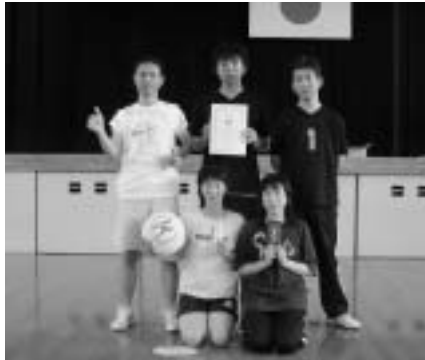
トリムフリーの部優勝 KX