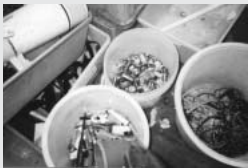
選別された不燃物