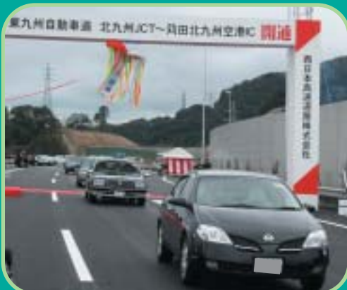
東九州自動車道苅田北九州空港インターチェンジから北九州ジャンクションまでの走り初め

苅田町にとって長年の悲願であった新北九州空港が3月16日、いよいよ開港します。2月26日には東九州自動車道苅田北九州空港インターチェンジが、3月5日には空港連絡道路が一足早く開通し、空港開港を待つばかりとなりました。