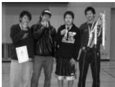
一般男子の部優勝