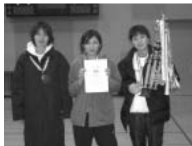
一般女子の部優勝