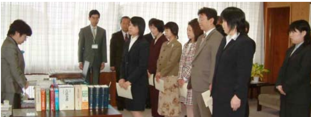
▲町費任用の教員10人への辞令交付式

3月31日付で教育特区（「未来を拓く子どもを育てる教育の町 荻田」特区）が国から認定され、4月18日に首相官邸で認定書が授与されました。この特区は町立小・中学校における1学級の児童または生徒数の基準を「34人以下とする」（現行は40人以下）というもので、学級の人数が多い小・中学校合わせて5校に、町費で任用した教員10人を配置し、小学校では1・2年生、中学校では1年生で1クラス30人規模の学級編制を行いました。少人数学級導入により、教員の目が細かく行