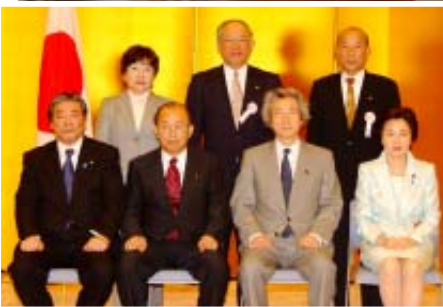
▲首相官邸にて（4月18日）