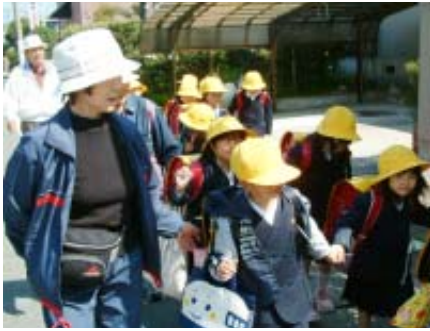
▲登下校の安全を守るため、地域の区長会、婦人会や老友会、保護者のみなさんにサポートしていただいています。

非行防止活動として青色回転灯をつけた専用車で指導員（警察官OB等）が町内を巡回したり、各小中学校では非行防止学習を行ったりして、子どもの健全な育成に取り組みます。さらに登下校の安全対策として町内の危険箇所を表示する看板を設置します。また、地域による巡回活動など行政・学校・警察・保護者・地域の方々が協働して子どもを守り育てます。