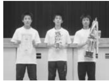
一般男子団体優勝 苅田工業高校A