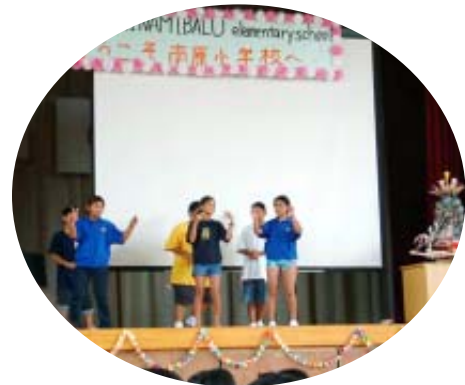
▲北マリアナ連邦の子どもたちを迎えての国際交流（平成16年度、南原小学校）

今年度は7月にグアムから6人の子ども大使が苅田小・南原小・馬場小の家庭にホームステイにやってきました。外国の子どもたちとふれあうことで国際理解を深め、国際感覚を培い、自分を見つめるとともに、世界へと視野を広げさせることがねらいです。昨年までは南原小学校1校だけの実施でしたが、本年は3校に広がりました。今後、町内にさらに拡大していくと考えています。子どもたちも楽しみに待っています。