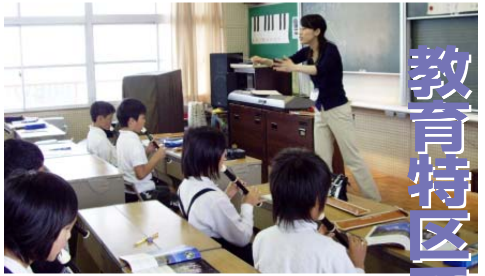
▲専門の教員による音楽の授業（専科指導）

地方分権、少子高齢化が進む中、従来の枠にとられない地域の実情にあった教育改革が求められています。