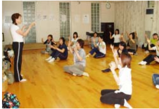
▲教職員の研修（レクリエーション）

「教育は人なり」と言われます。そこで町では全教職員を対象に体験型教育研修会を実施し、教職員の資質向上をめざします。内容はカウンセリング、英会話、パソコン実技、特別支援教育、野外体験、図書室経営、マナー講座等9講座（予定）で演習・実習を主とした研修により、教職員の実践的指導力の向上を図ります。