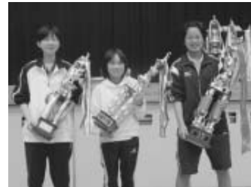
一般女子団体優勝 苅田送球会A