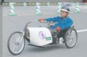
小波瀬川イカダ大会優勝の(株)山崎工業、「チームyamasaki」で初参戦。