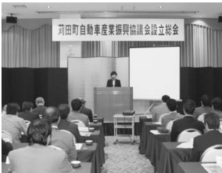
▲8月31日に行われた苅田町自動車産業振興協議会