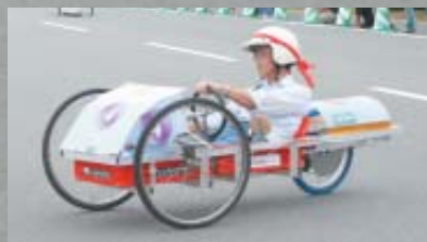
▲ドライバーは教頭先生。苅田工業高校の「ハヤブサ」