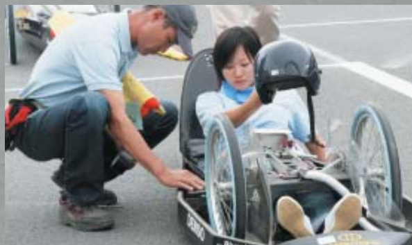
▲出走前に最後の調整をするチームカンダの「H-1」。見事優勝、「T-3」も2位に。