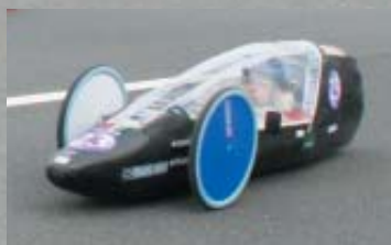
▲西日本工業大学の「西工大NSX」。総合7位に。