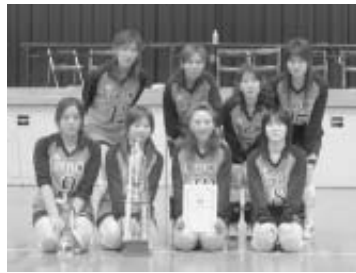
▲青年女子の部 優勝

①インフィニ ②新津クラブ 青年女子の部 ①アローズ ②豊津フレンズ ③ARATSUクラブ ママさんの部 ①若葉クラブ ②愛友クラブ ③ウインクラブ