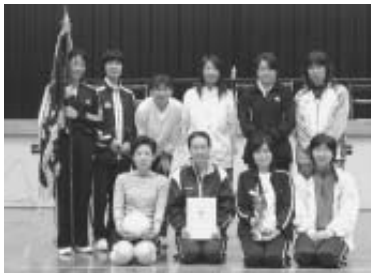
▲ママさんの部 優勝