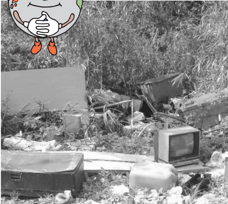
▲不法投棄監視カメラ設置場所（設置前の不法投棄の状況）