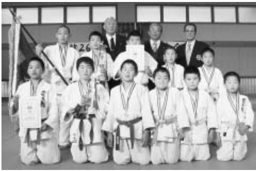
▲柔道団体戦優勝 豊友館道場A