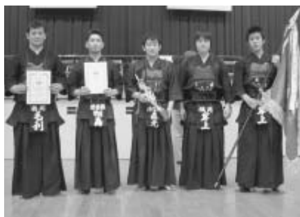
▲剣道一般の部優勝