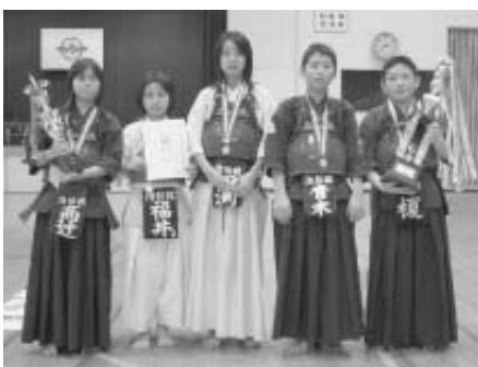
▲剣道小学生団体戦の部優勝