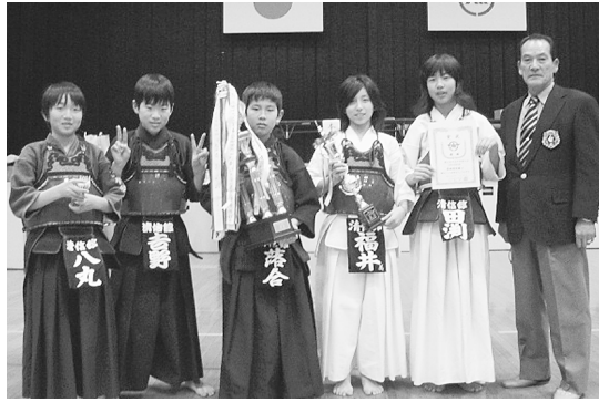
剣道 小学生の部 優勝