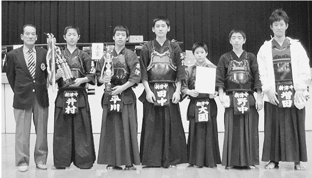
剣道 中学生の部 優勝