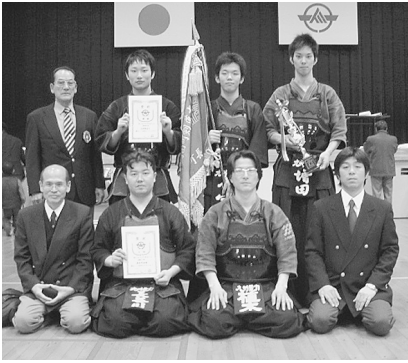
剣道 一般の部 優勝