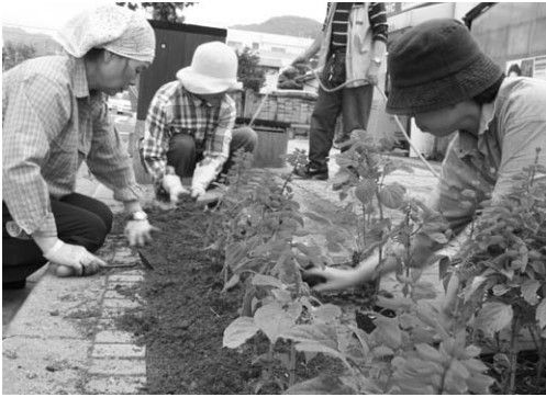
▼ 苅田駅前の歩道に花を植えました。

ボランティア連絡協議会では、苅田町総合保健福祉センター（パンジープラザ）を拠点にレストランの運営や高齢者への配食業務など福祉ボランティア活動を続ける傍ら、「苅田町を訪れる方々に、良い印象をもっていただく」と会員が持ち寄った花の苗をパンジープラザや役場庁舎、6月中旬には苅田駅前のロータリーや歩道に色彩鮮やかな季節の花を植え、「やすらぎ