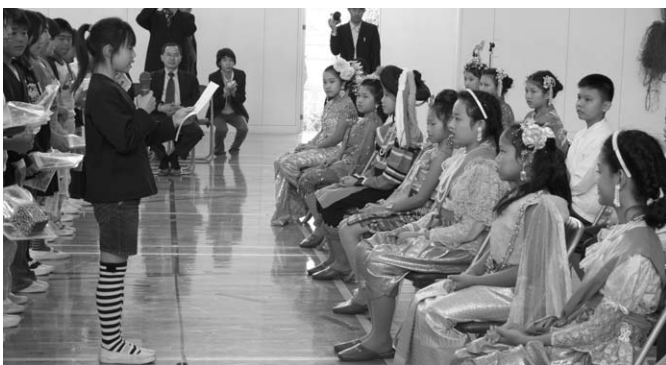
バンコク少年少女訪問団と馬場小学校児童との交流

が、議員の皆様並びに町民の皆様への町政に対するご理解と一層のご協力をお願い申し上げます。