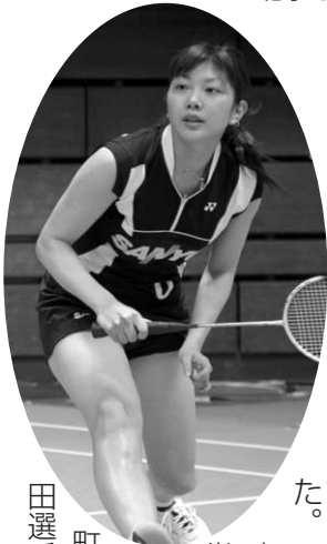
潮田玲子選手のオリンピック出場を 祝う看板・横断幕等を設置 いたしました。また、8月10日 からのオリンピック・バドミ ントンダブルス競技において は、町施設でパブリックビュ ーイング(注4)を計画し、 町を挙げて応援したいと考え ております。

訴いたしました。 裁判を進めていく中で、裁判所より和解案が提示され、双方は、これを受け入れ、本年4月28日、正式に和解が成立いたしました。和解条項の主なものとしては、相手方が荻田町に対して和解金として200万円を支払うというものでございます。 男女共同参画 次に、男女共同参画についてでございます。「荻田町男女共同参画推進条例」を平成19年7月1日より施行しておりますが、この条例で定める苦情処理制度を4月1日より開始いたしました。 この制度は町が実施する施策に関し、性による差別的取り扱いなどの被害者の救済を図るため、町が任命した苦情処理委員が町民の皆様からの申出を受け、必要な対応を行うということとさせていただきます。