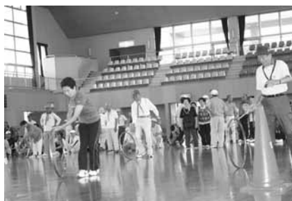
▲子ども時代の遊び安全運転！