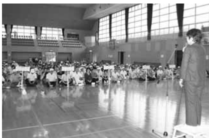
▲開会式での町長挨拶

競技に参加 な眼差しで 指して真剣 も優勝を目 各チームと れており、 ームに分か ごとに8チ じめ各校区 者はあらか 加者が400名にものぼりました。参加