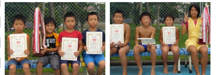
写真はリレー部門の優勝チーム(左上)男子100m 苧田小C(左下)女子100m 与原小A(上)混合100m 苧田小